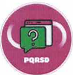
Imagen y descripción